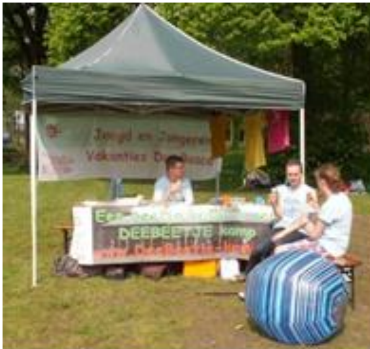
Promotie van DeeBeetje-kamp bij het kinderfort (Fort Vechten).

Naast al deze activiteiten probeerden we zoveel mogelijk bekendheid te geven aan de DeeBeetje-kampen door het plaatsen van artikelen in regionale kranten, door te flyeren in Apeldoorn, door leiding te vragen reclame te maken in hun omgeving en door grote weekbladen te interesseren.